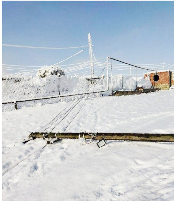
В селении Верхний Каранай и Ишкарты Буйнакского района из-за обильного сне-

гопада обвалились 2 опоры линий электропередач. Часть жителей сел осталась без света в течение суток.