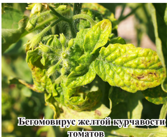
Бегомовирус желтой курчавости томатов