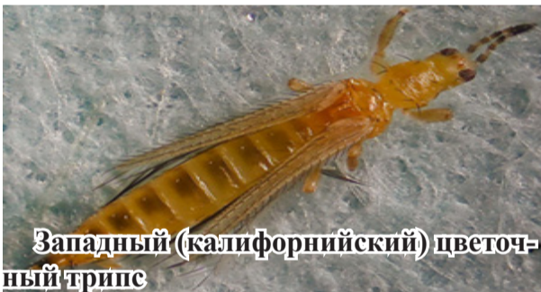
Западный (калифорнийский) цветочный трипс

Вредитель обладает высокой устойчивостью к большинству пестицидов, поэтому лучшим методом борьбы с ними является профилактика – важно не допустить попадание карантинного организма в тепличное хозяйство. Запрещен вывоз рассады, цветов и других растений без проверки и одобрения карантинной службы.