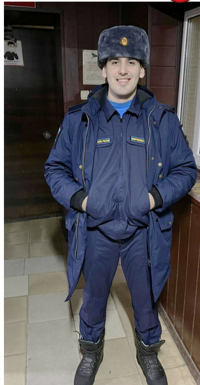
Материалы Б. МАГОМЕДБАШИРОВОЙ