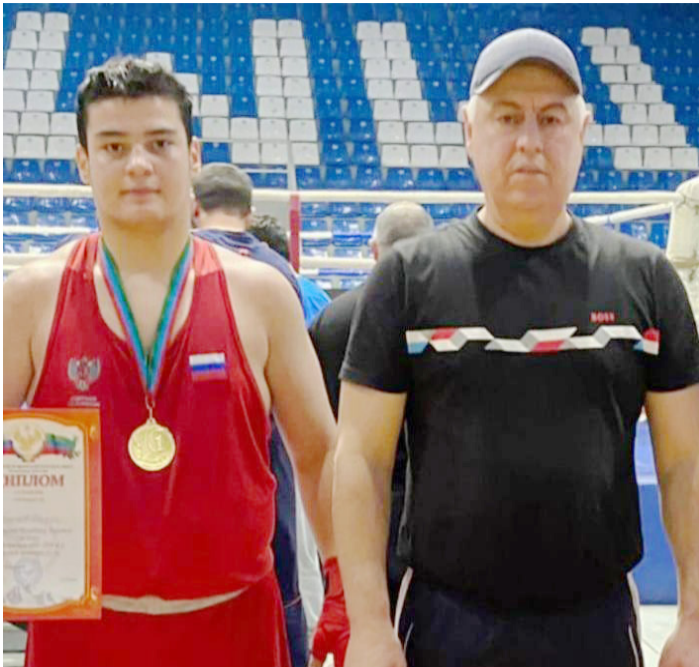
Спортсмен из Буйнакского района стал обладателем серебряной медали на первен-