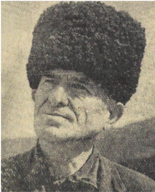
Фото А. Гадисова «ЛК» от 29 января 1971 г.